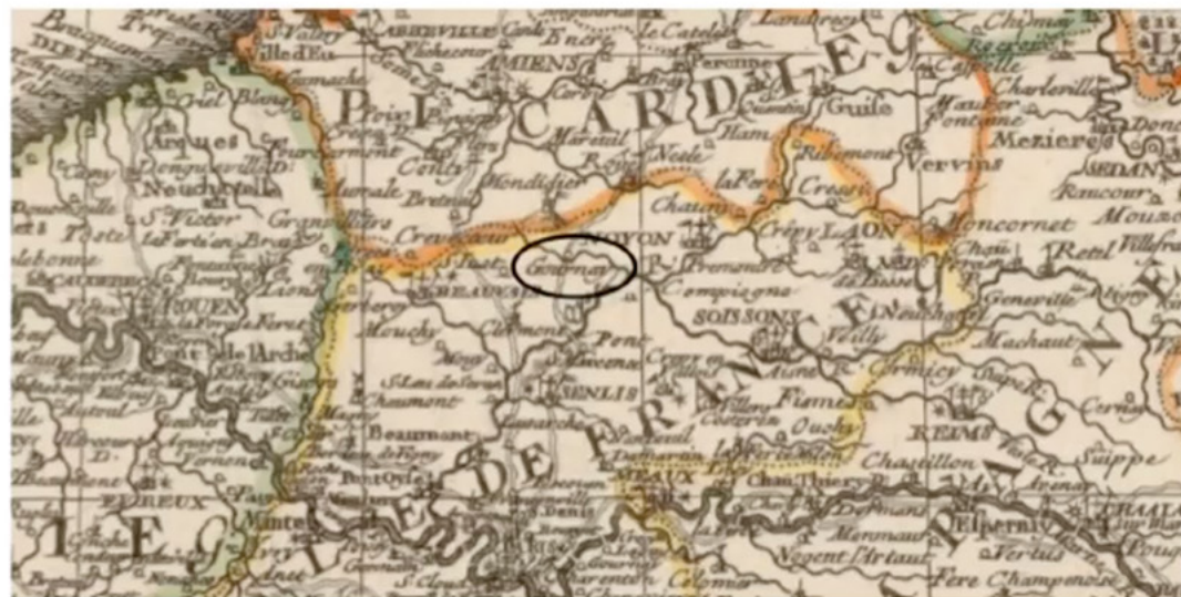
Jean-Baptiste Nolin, Le Royaume de France avec ses acquisitions divisée en gouvernements de provinces , seconde moitié du XVII e siècle.